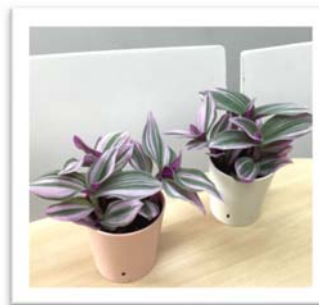
プラ容器鉢 8cm イメージ