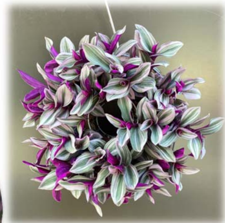
リースにもできます